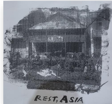
店主が見せてくれた昔の写真

昼食後、私たちはバレーパレ市内から三〇キロ離れたスリリバラット温泉へ行ってみることにした。