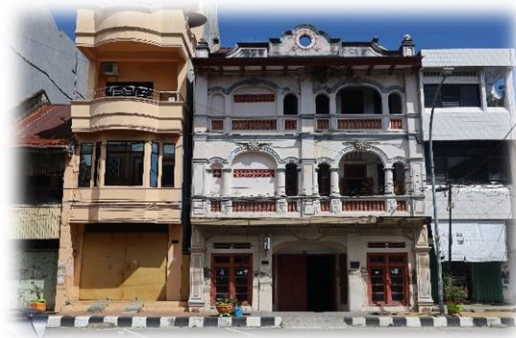
旧ヤマトホテル パラパレ市内

前に車が居れば追い越すことになっているらしい、これはバイクでも車でも同じで、その時、必ずクラクションを鳴らすのが合図のようである。